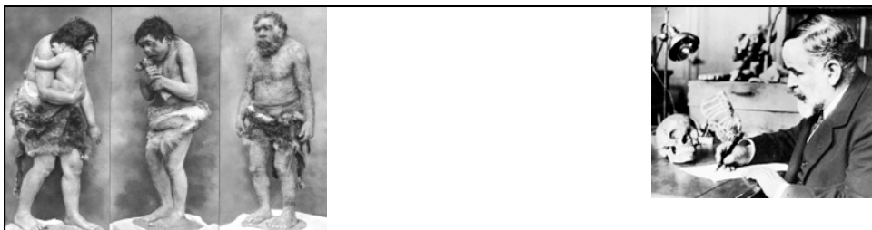
Marcellin Boules rekonstruktion i 1911 (La Chapelle-aux-Saints, 1908, første Neanderthal begravelsesplads): ubegavet, primitiv, behåret, abegtig