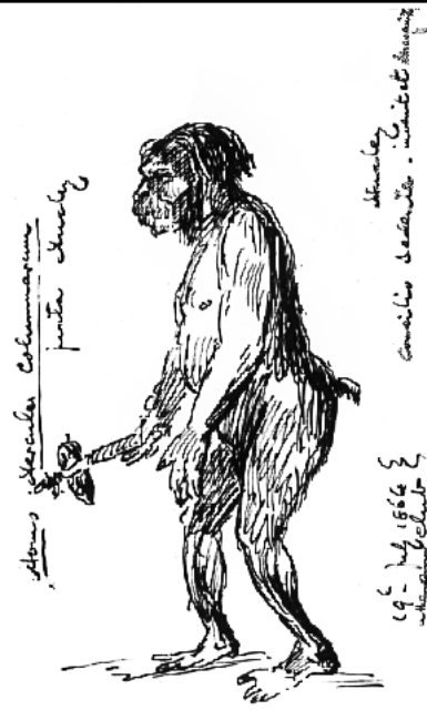
T.H. Huxley, "Pillars of Hercules Man", Athenaeum Club (1864)

"På ingen måde kan disse Neanderthal-knøglar anses for at være efterladenskaber fra en mellemform mellem aber og mennesker" ( Man's Place in Nature )