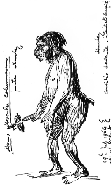
T.H. Huxley, "Piltdown Man", Athenaeum Club (1864)

"På ingen måde kan disse Neanderthal-knøbler anses for at være efterladenskaber fra en mellemform mellem aber og mennesker" ( Man's Place in Nature )