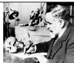
Marcellin Boules rekonstruktion i 1911 (La Chapelle-aux-Saints, 1908, første Neanderthal begravelsesplads): ubegavet, primitiv, behåret, abegtig